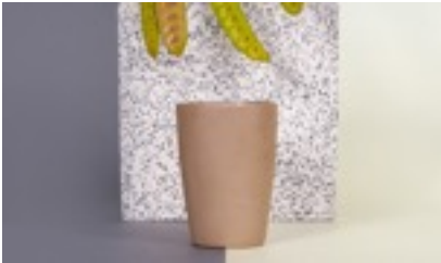
Lagos del Mundo