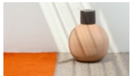
Lagos del Mundo